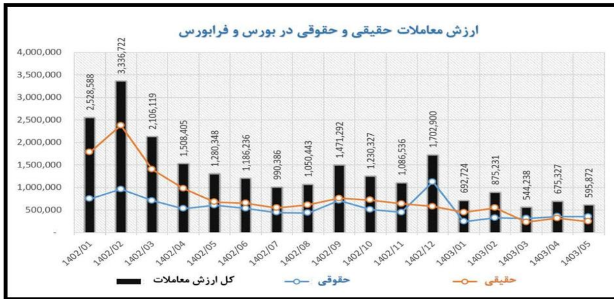
شکل (۱): ارزش معاملات حقیقی و حقوقی در بورس و فرابورس

همان طور که در شکل (۱) مشاهده می‌شود با وجود تورم بیش از ۵۰ درصدی، ارزش معاملات سال ۱۴۰۳ نسبت به سال ۱۴۰۲ در حدود ۲۵ الی ۳۰ درصد کاهش داشته است. ترکیب ارزش معاملات در بورس و فرابورس تغییر چشمگیری نداشته ولی افت به طور میانگین ۵۰ درصدی معاملات حقیقی نسبت به سال قبل حاکی از عدم اقبال افراد به بازار سرمایه است و می‌توان آن را در نتیجه مسائل ژئوپلیتیک و ریسک‌های سیستماتیک بازار سهام و ابزارهای کنترل‌کننده بازار از جمله محدودیت دامنه نوسان دانست.