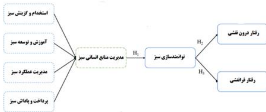
شکل (۱): مدل مفهومی تعدیل شده از پژوهش ریبر راشدین و همکاران (۲۰۲۳)