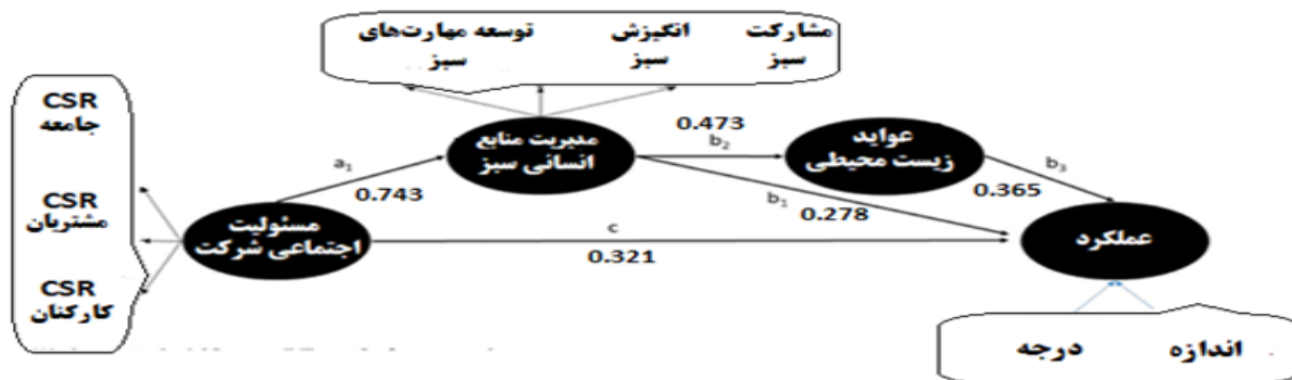
شکل (۲): نتایج معادلات ساختاری و ضرایب مسیر