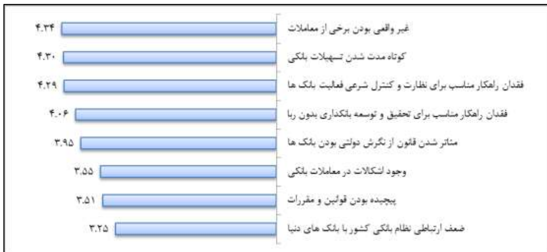
نمودار ۱: رتبه بندی عوامل تاثیرگذار در چالش های نظام بانکداری اسلامی