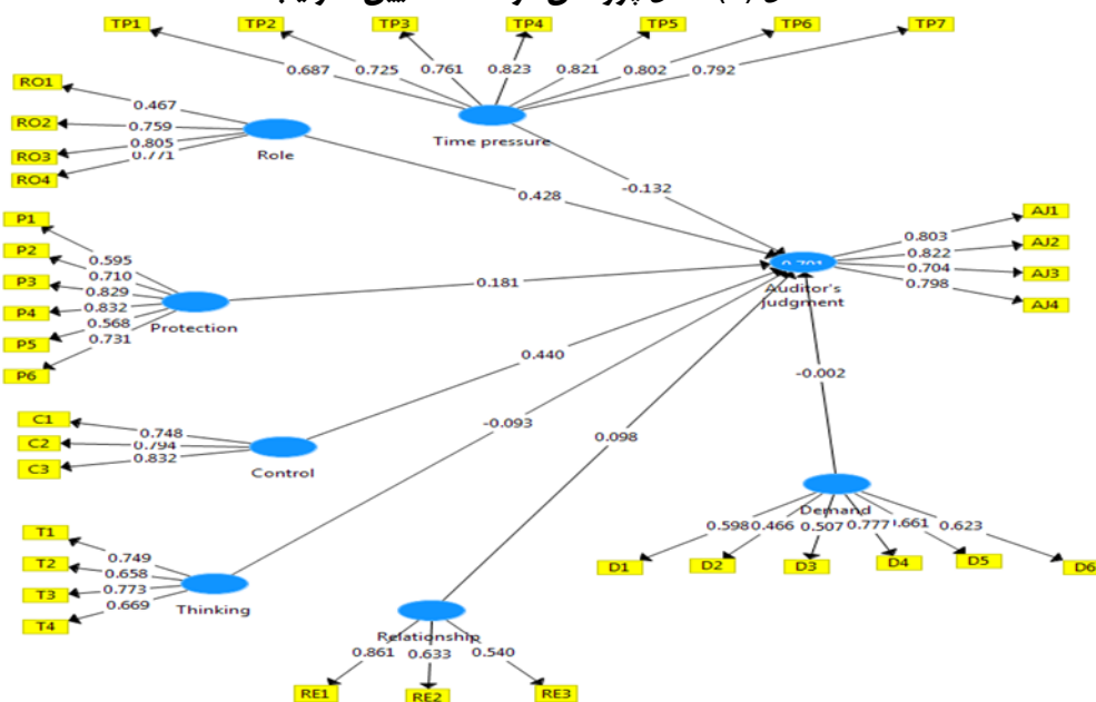
شکل (۱): مدل پژوهش در حالت تعیین ضرایب